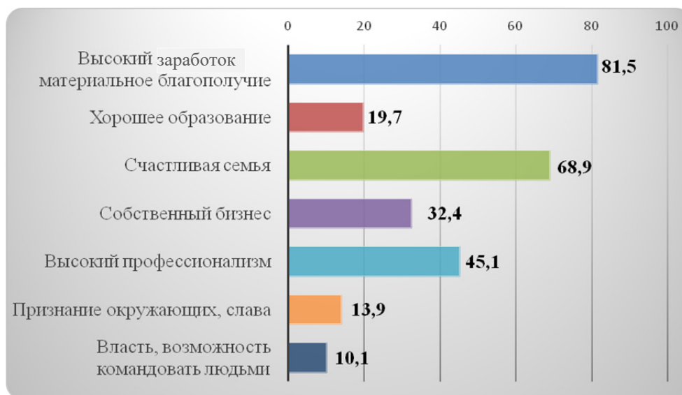
Рис. 3. Жизненные цели молодежи Пензенской области ( n = 395 , процент от числа опрошенных; многовариантные ответы)

Опрос среди молодежи Пензенской области показал, что основные цели, которые ставят перед собой молодые люди, связаны с материальными благами (81,5 %) (рис. 3).